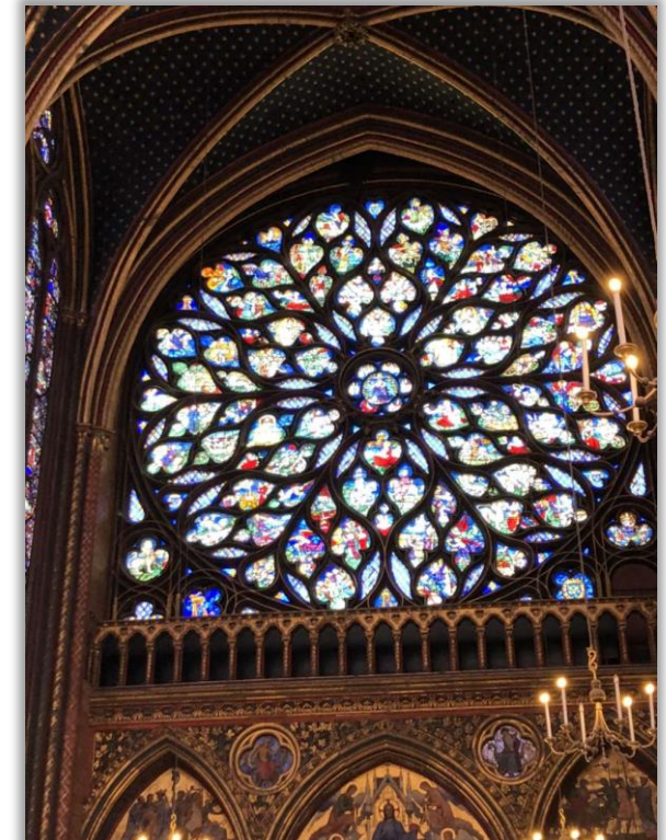
Roses et vitraux 17/09/21 Wideline.O