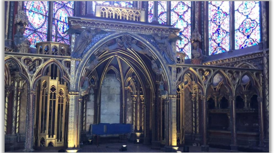
Eglise du Roi 17/09/21 Marie-Lucie.L

Cette chapelle est constituée d'étages, le premier réservé au peuple. Le deuxième étage qui constitue l'église du roi. C'est là que toutes les reliques étaient stockées. Les reliques sont des vestiges pour que le roi montre son pouvoir.